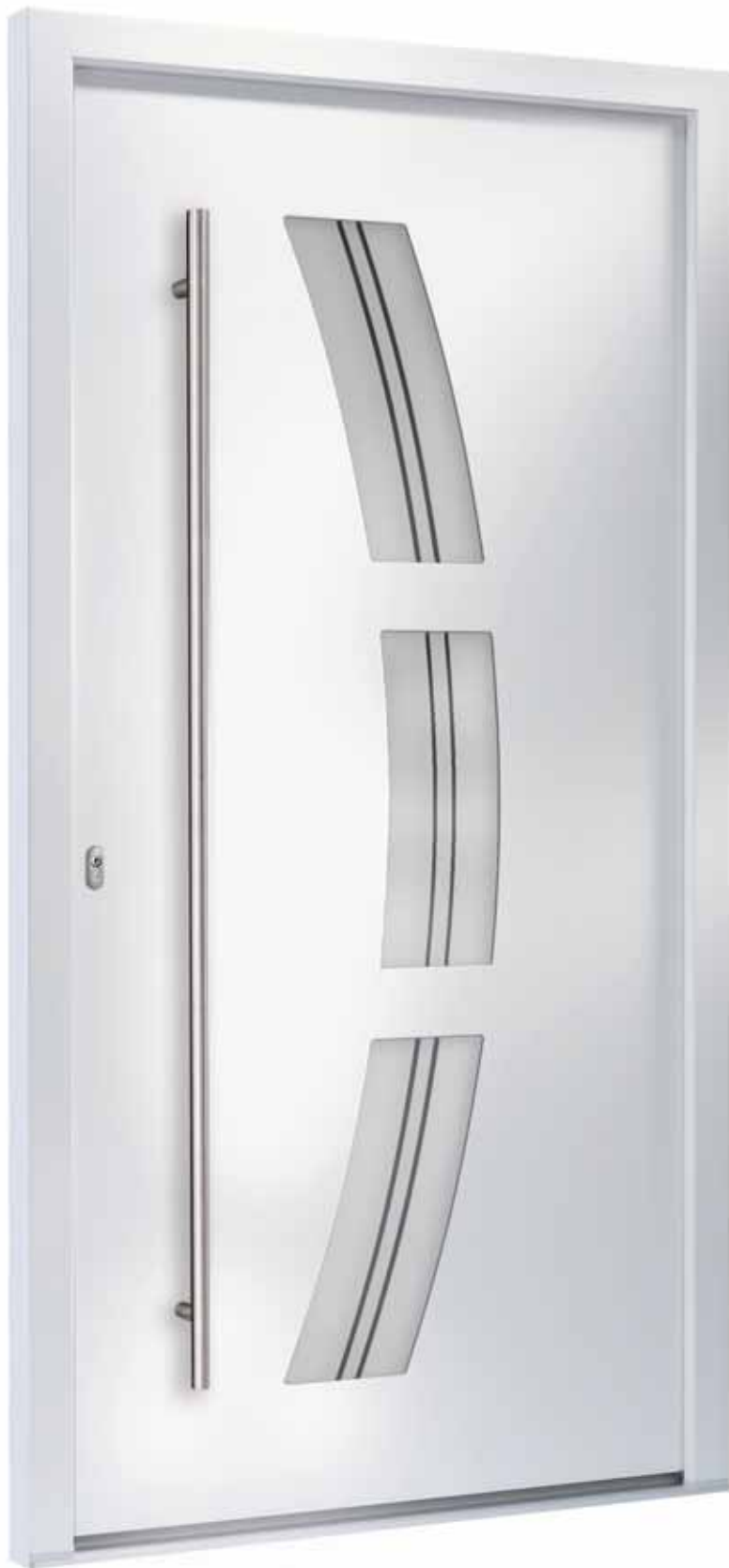
A | Modell 7748-50 | Glas: G 1310 mattiertes Glas mit klaren Streifen | Aufsatzfüllung | Mit 1600 mm Edelstahl-Stangengriff