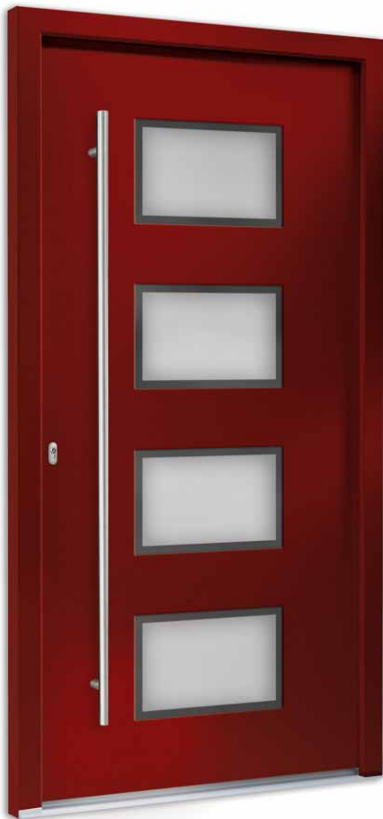
A | Modell 7750-50 | Glas: G 500-25 mattiertes Glas mit klarem Rand | Farbe: RAL 3004 Rubinrot | Aufsatz- füllung | Mit 1600 mm Edelstahl- Stangengriff