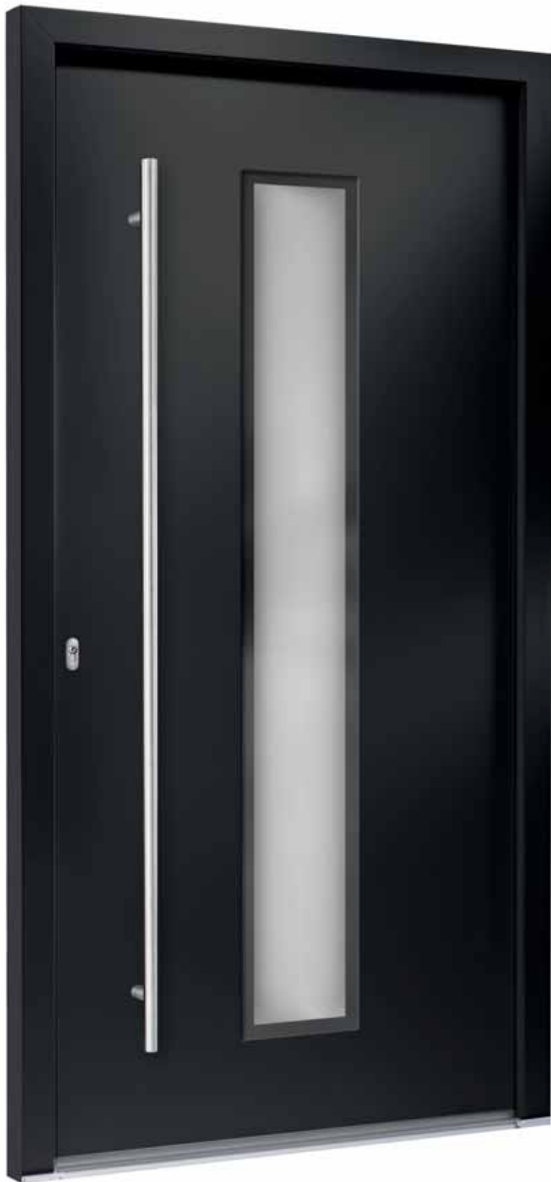
A | Modell 7740-50 | Farbe: RAL 7016 Anthrazitgrau | Glas: G 500-25 mattiertes Glas mit klarem Rand | Aufsatzfüllung | Mit 1600 mm Edelstahl-Stangengriff