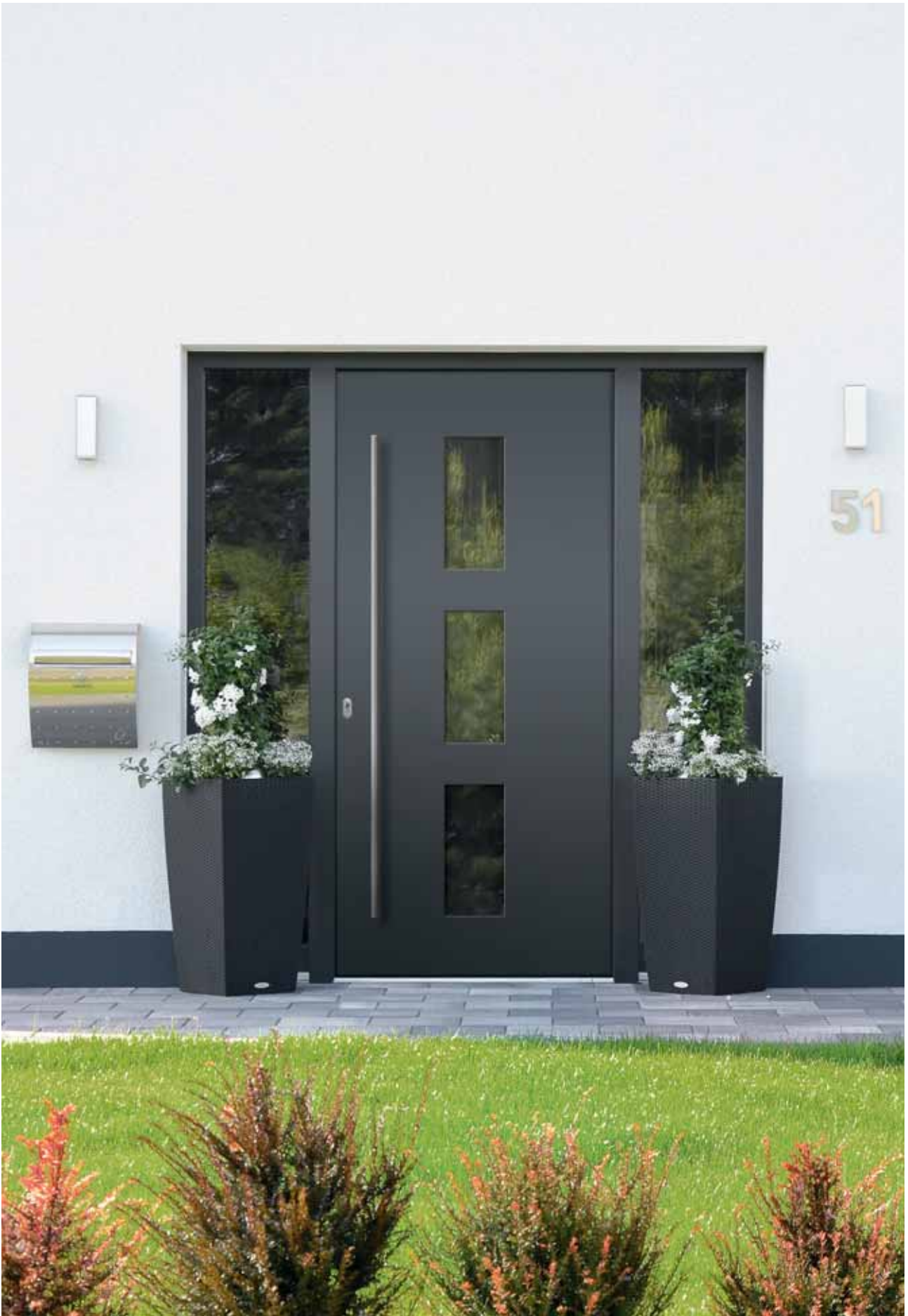
Modell 7745-50 mit Ganzglas-Seitenteilen | Farbe: RAL 7016 Anthrazitgrau | Glas: Klarglas | Aufsatzfüllung | Mit 1600 mm Edelstahl-Stangengriff