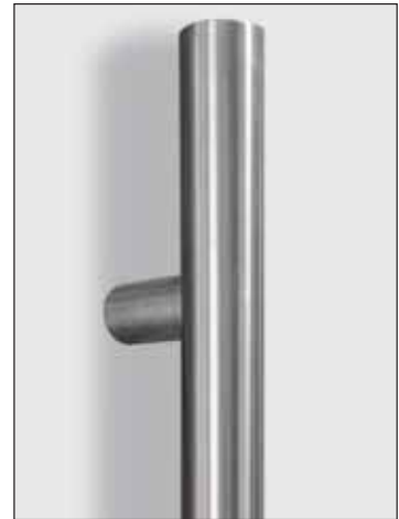
Integrierter Edelstahl-Stangengriff in verschiedenen Längen 400 mm bis 2000 mm erhältlich