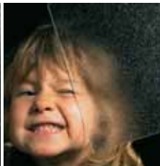
Ornament 504 weiß