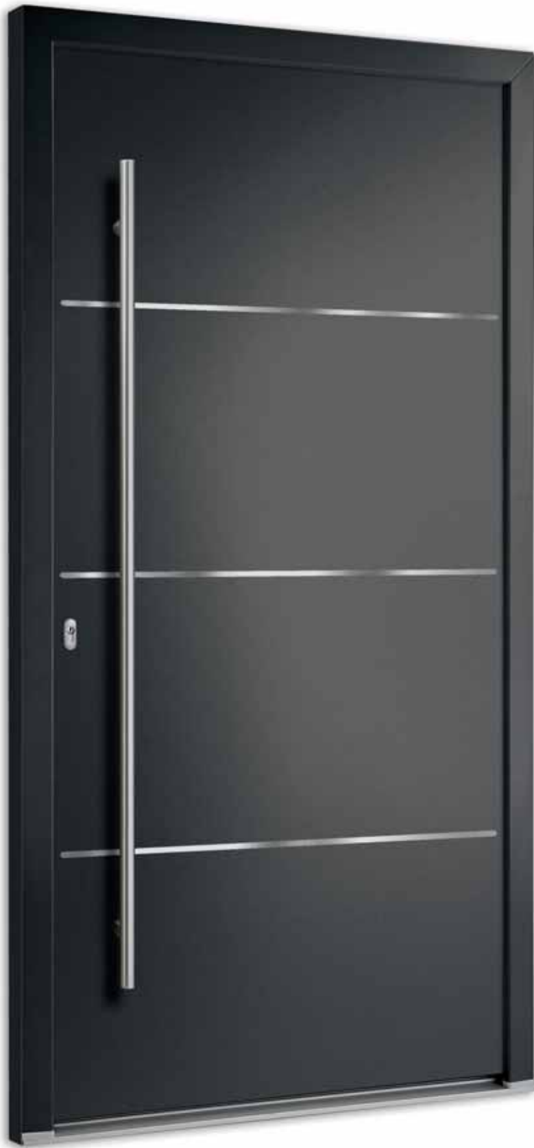
A | Modell 7730-94 flächenbündige Lisenen | Farbe: RAL 7016 Anthrazitgrau | Aufsatzfüllung | Mit 1600 mm Edelstahl-Stangengriff