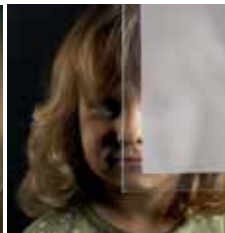
Mattiertes Glas mit klarem Rand